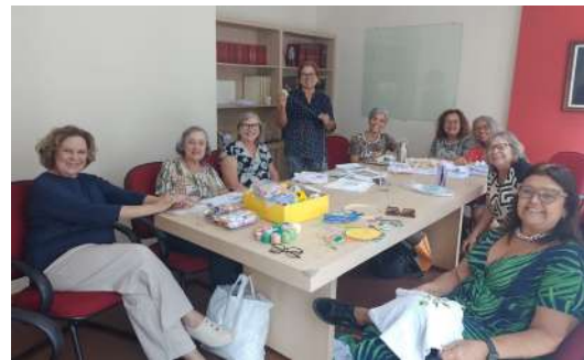
Artesãs: em plena atividade