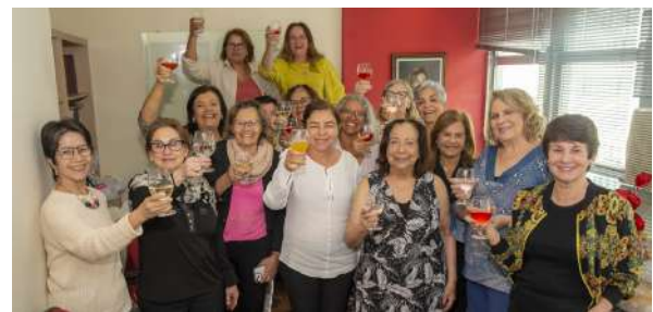
Artesãs: comemorando os 7 anos de arte e ofício na AAPPU

Também no dia 15 de dezembro elas se reuniram na Associação em confraternização regada a muita alegria e satisfação pelo trabalho feito.