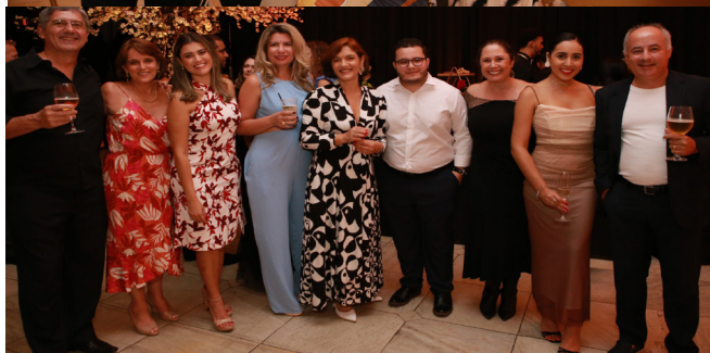
Amigos da Previdência Usiminas