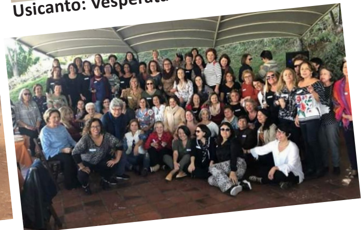
Mulheres de Aço