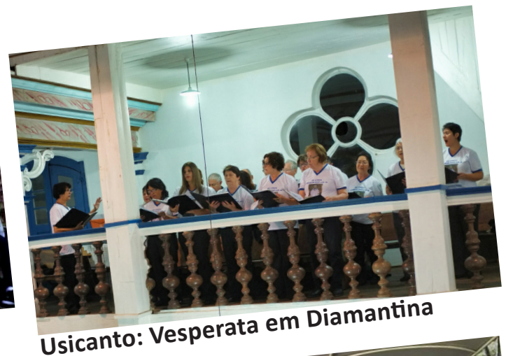
Usicanto: Vesperata em Diamantina