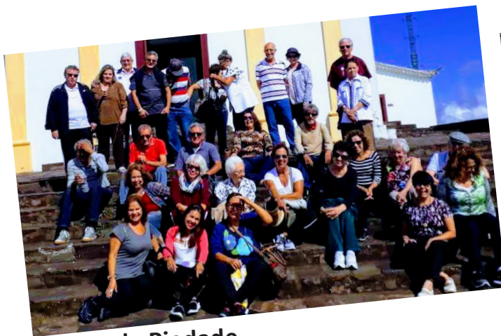
Serra da Piedade