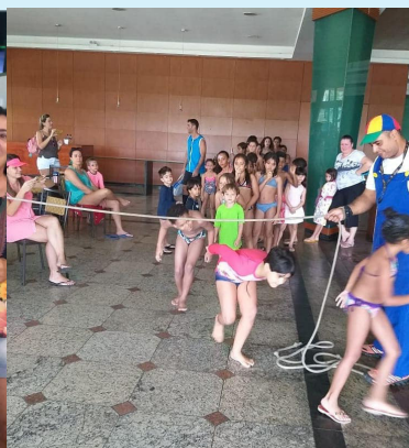
Festa da Criança