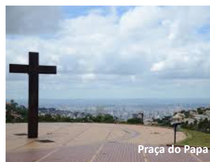
Praça do Papa