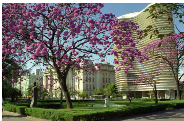
Praça da Liberdade - Belo Horizonte

Viajar é uma das melhores formas de se combater o estresse. E de conhecer as belezas que muitas vezes estão tão próximas. Confira as sugestões da AAPPU nas págs. 5 e 6.