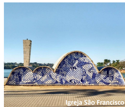
Igreja São Francisco

Praça do Papa - Com uma encantadora vista urbana da cidade, ganhou este nome depois que o Papa João Paulo II ali celebrou uma missa. Visita panorâmica ao centro de Belo Horizonte. O tour começa às 14h, terminando às 18h.