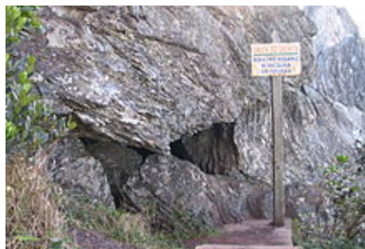
Gruta do Eremita, onde Frei Rosário se recolhia