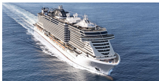
Navio MSC SEAVIEW