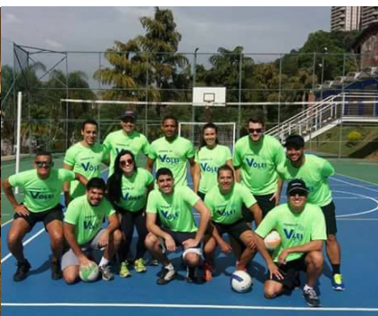
II Torneio Relâmpago de Vôlei