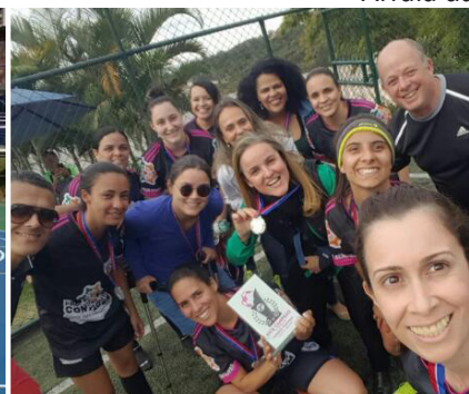
V Torneio de Futebol Feminino