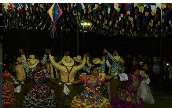
Arraiá da AEU