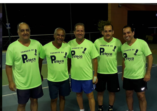
VII Torneio de Peteca