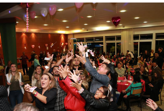
Noite das Mães