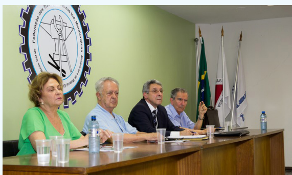
ASSEMBLEIA DISCUTE SEGURO COM ASSOCIADOS – PÁG. 5